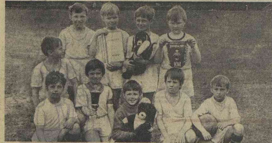
Мальчишки счастливы! Главный приз Ленинградского турнира «Команый мяч» в младшей возрастной группе завоевала команда «Прометей» жилищуправления № 1 Кировского района Ленинграда. В финальном поединке «Прометей» выиграла со счётом 1:0 у команды «Дружба» Красносельского района.